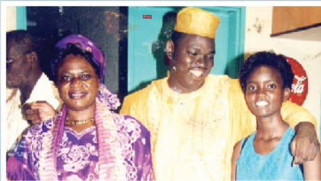
Soutenance de la Maîtrise à la CATHO