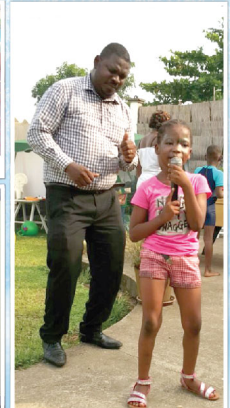
Pas de danse avec sa "maman"