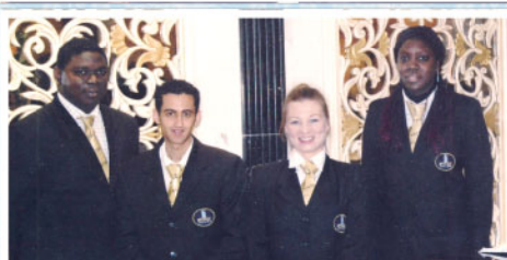
Soutenance du diplôme en Management hôtelier (Tunis)