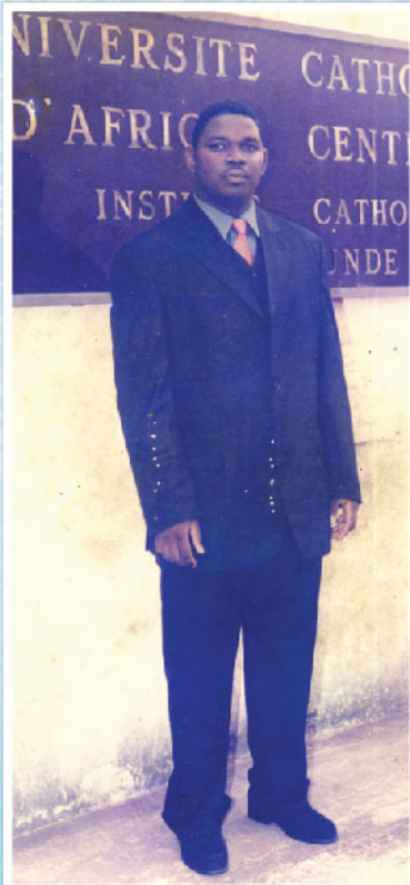
Soutenance du DESS à la CATHO