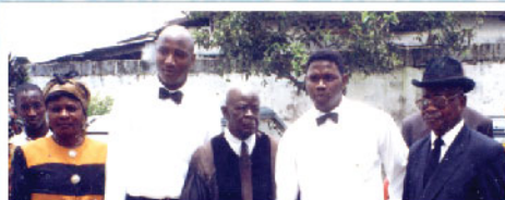
Baptême & confirmation à PENIEL