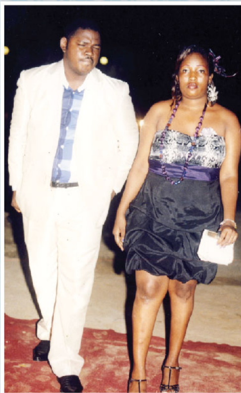
Sortie en amoureux avec sa dulcinée