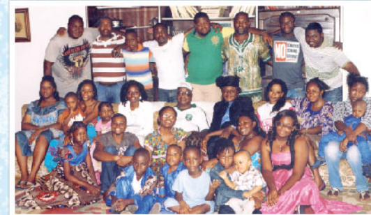
Fraternité des SOUN SOUN